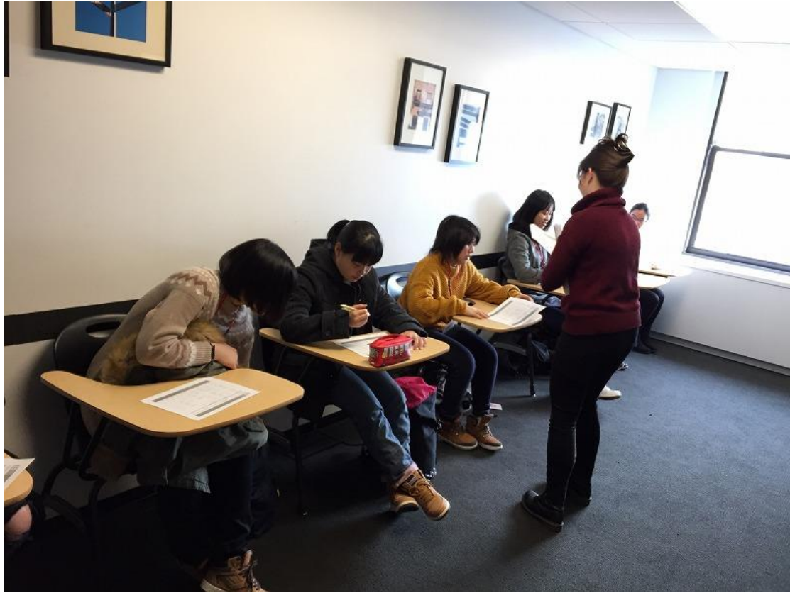
プレースメントテスト① (Reading)