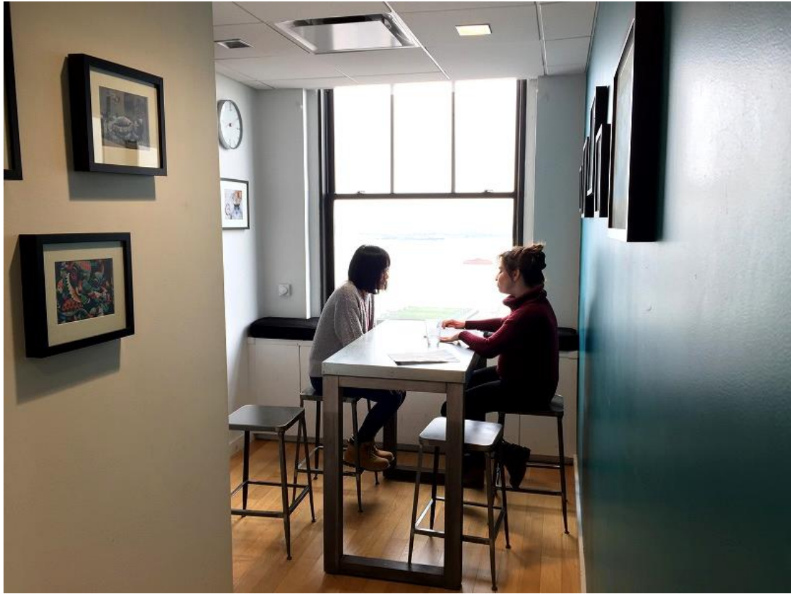
プレースメントテスト③ (Speaking)