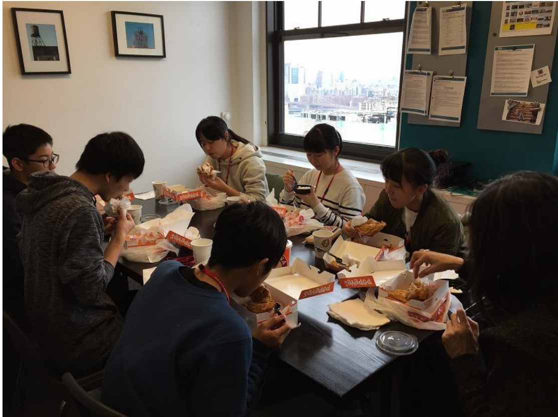
アクティビティリーダーとランチ②