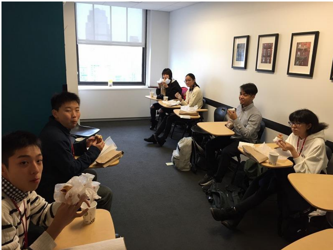
アクティビティリーダーとランチ①