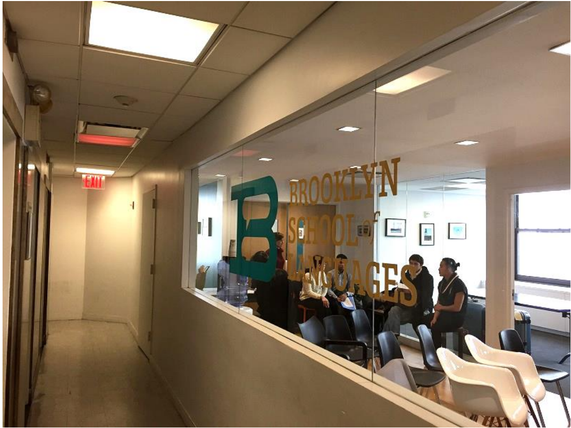
語学学校（BSL）への登校練習をしました