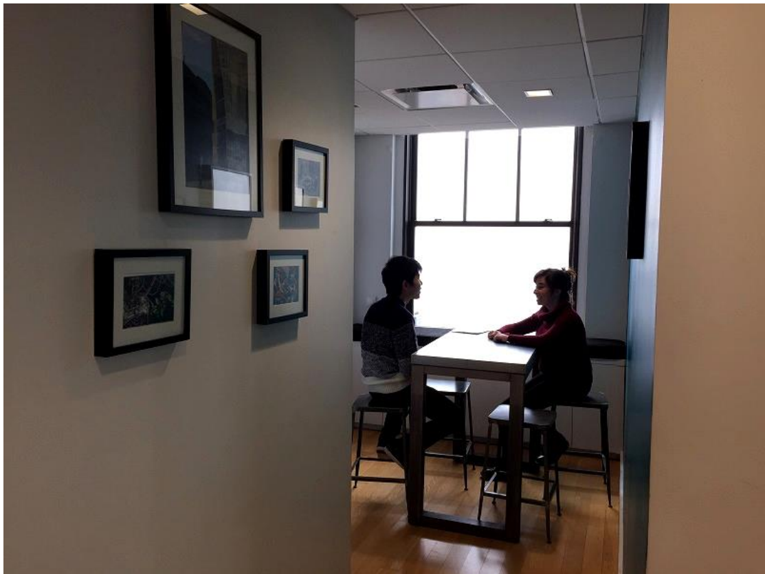
プレースメントテスト② (Speaking)