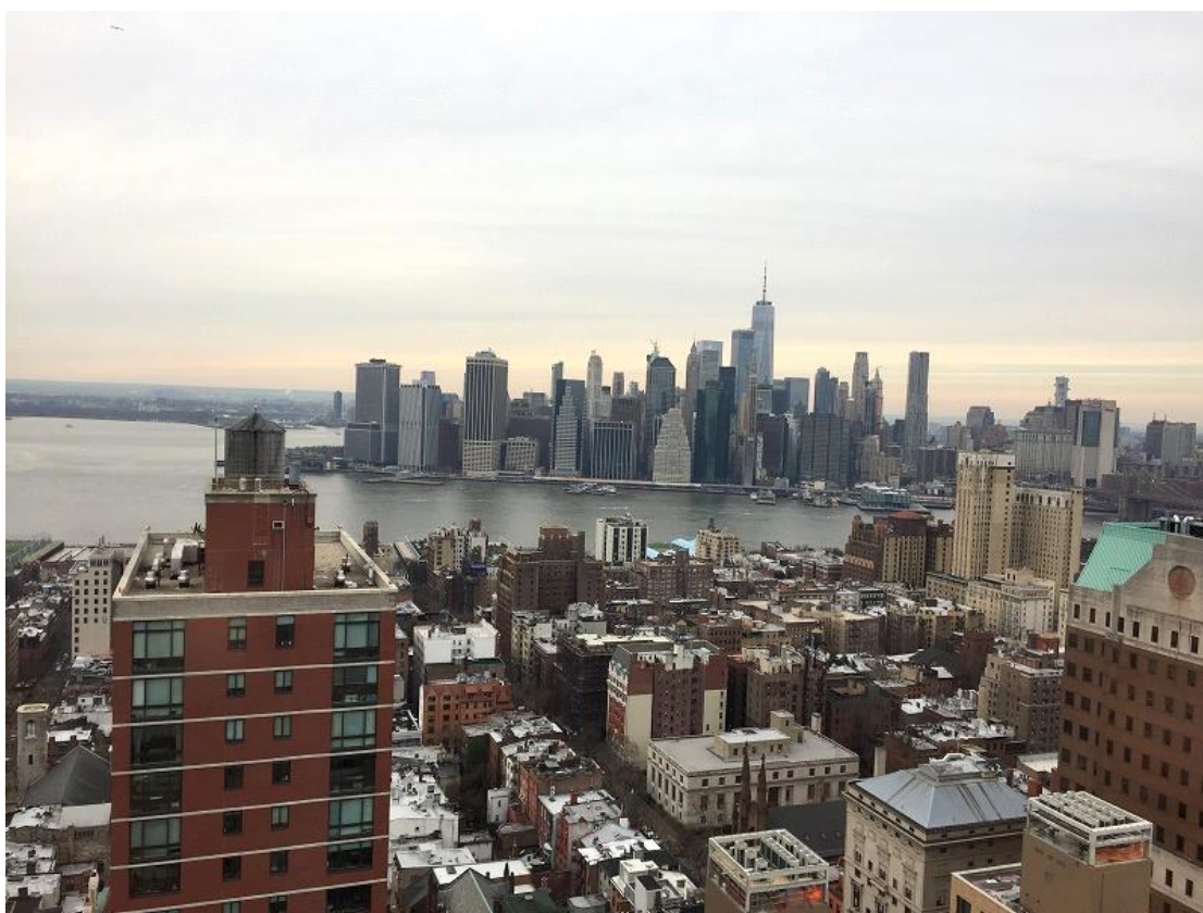
語学学校からはマンハッタン島や自由の女神も見渡せます