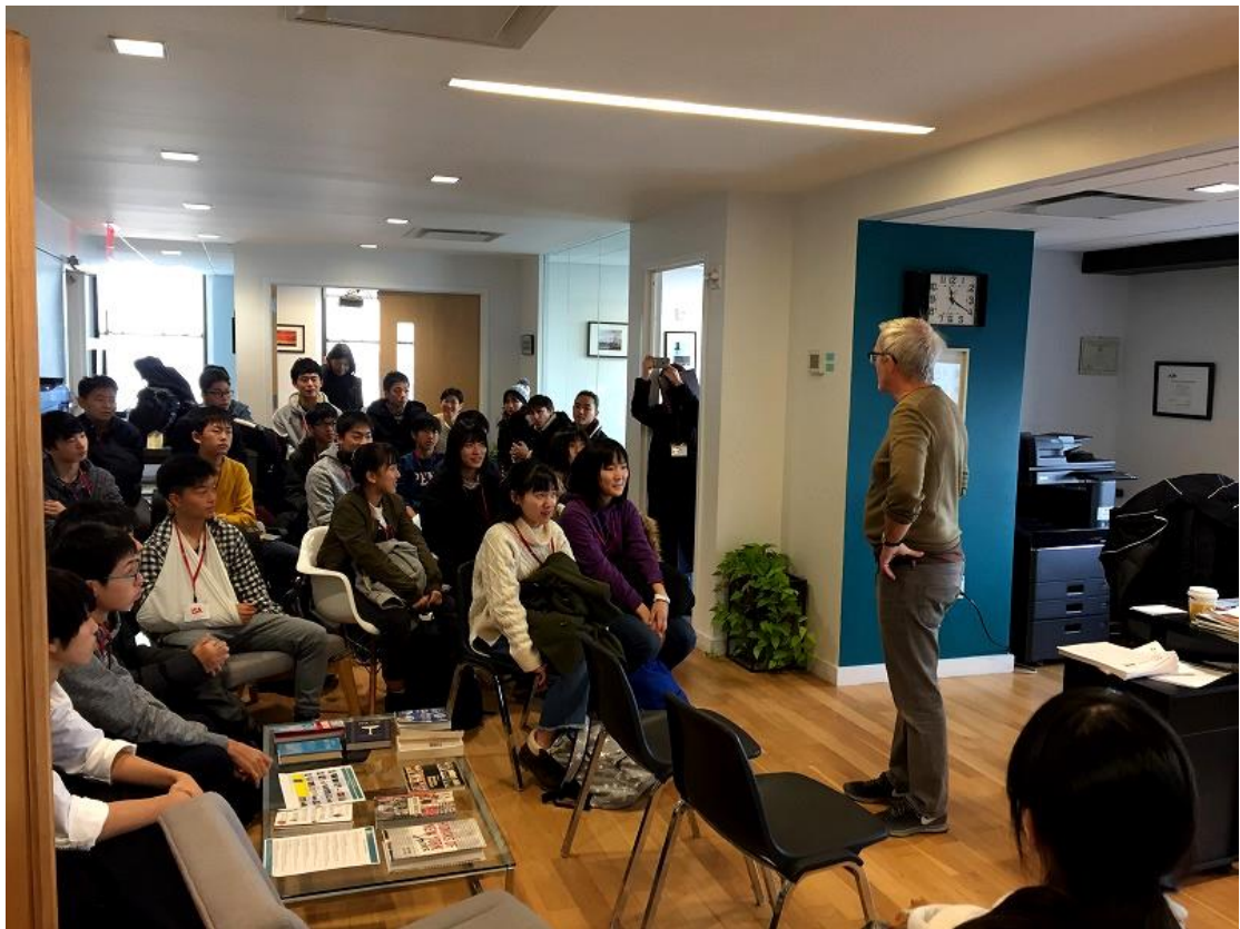
BSL 校長先生からのインストラクション