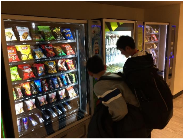
【レジでは使いづらい小銭消費。。。】