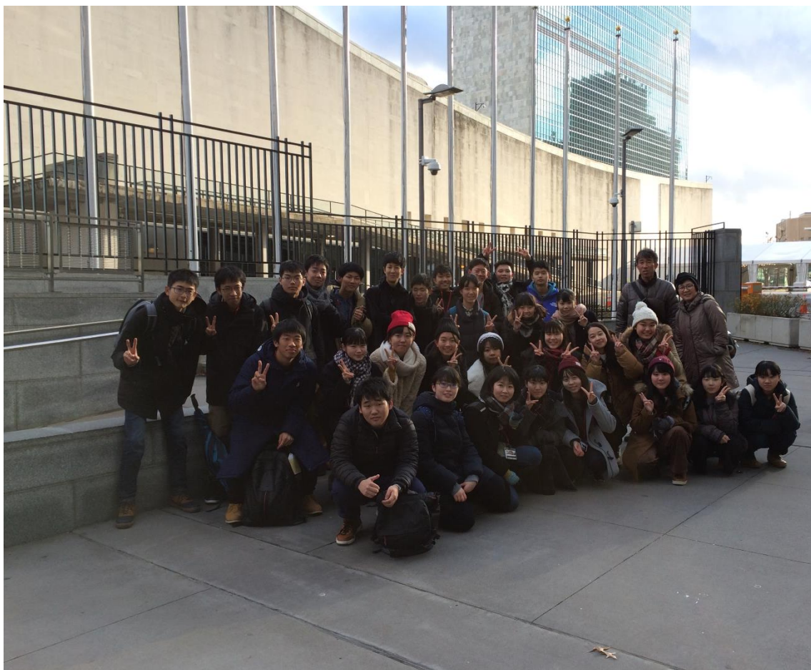
【国連にて（今日は国旗が出ていませんでした）】