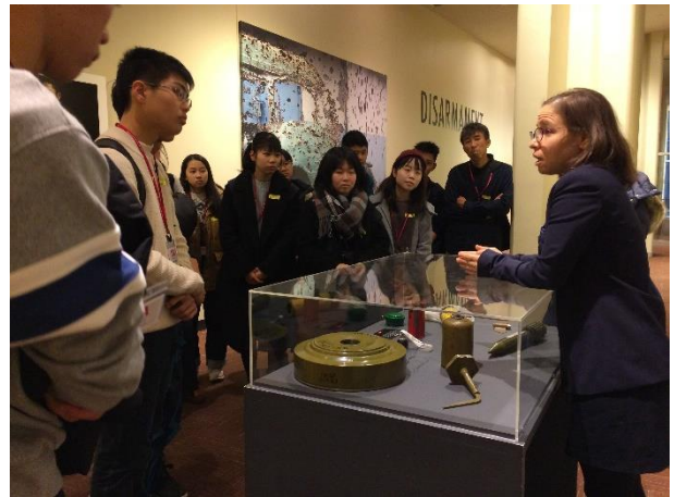
【気になる事はしっかりと質問です】