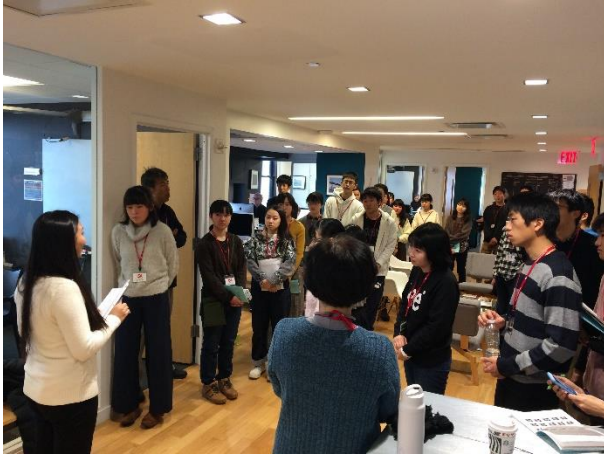
【朝のミーティングの様子】