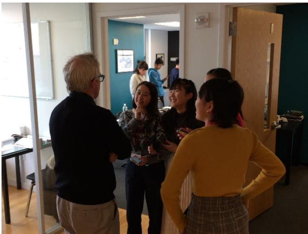
【休憩時間、積極的に話しかけています】